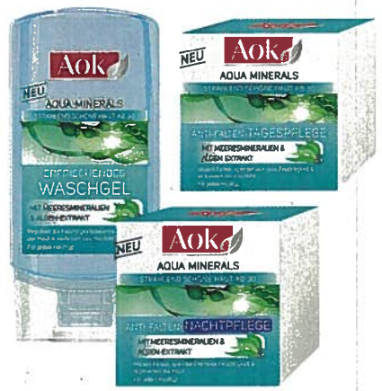
Aok Aqua Minerals: Die Linie umfasst Waschgel, Tages- und Nachtpflege